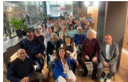
Cierzo Brewing, Saragossa