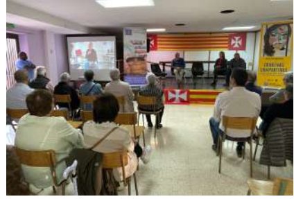
Parròquia la Mercè, Lleida