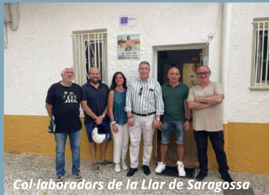
Col·laboradors de la Llar de Saragossa

Agraïm de manera especial la col·laboració de totes les persones que ens donen suport (amb donacions o comprant loteria), a les parròquies que han realitzat la Campanya de Nadal , als Amics de la Mercè i a les persones que apadrinen .