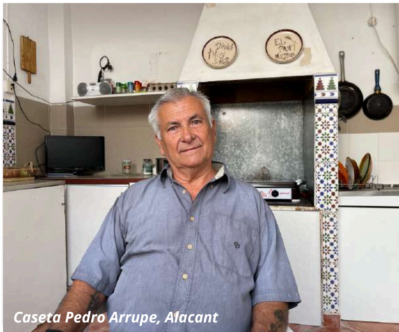
Caseta Pedro Arrupe, Alacant

A mi se m'ha ajudat, per la qual cosa també cal ajudar als altres que han estat com jo.