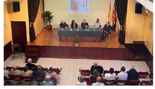
Col·legi Sant Agustí, Mallorca