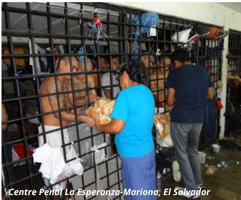
Centre Penal La Esperanza-Mariona, El Salvador

Dir-li a la família que entres a la presó és la part més dura de tot el que concerneix a la presó.