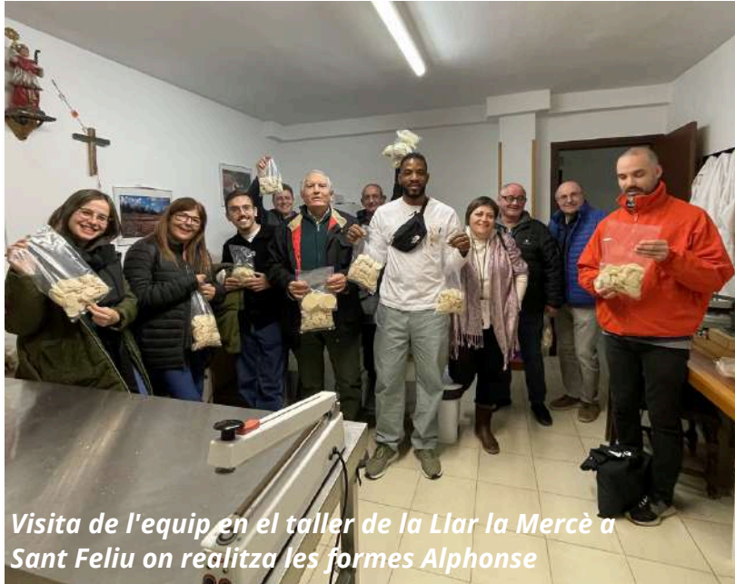
Visita de l'equip en el taller de la Llar la Mercè a Sant Feliu on realitza les formes Alphonse

Quan surts de la presó, la Fundació Obra Mercedària t'orienta i t'ajuda a buscar un futur millor.